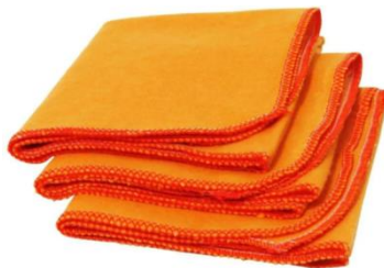
01 POLIDOR DE METAIS