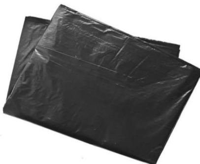
06 SACOS PLÁSTICOS (TIPO DE GELO) CAPACIDADE 50 LITROS